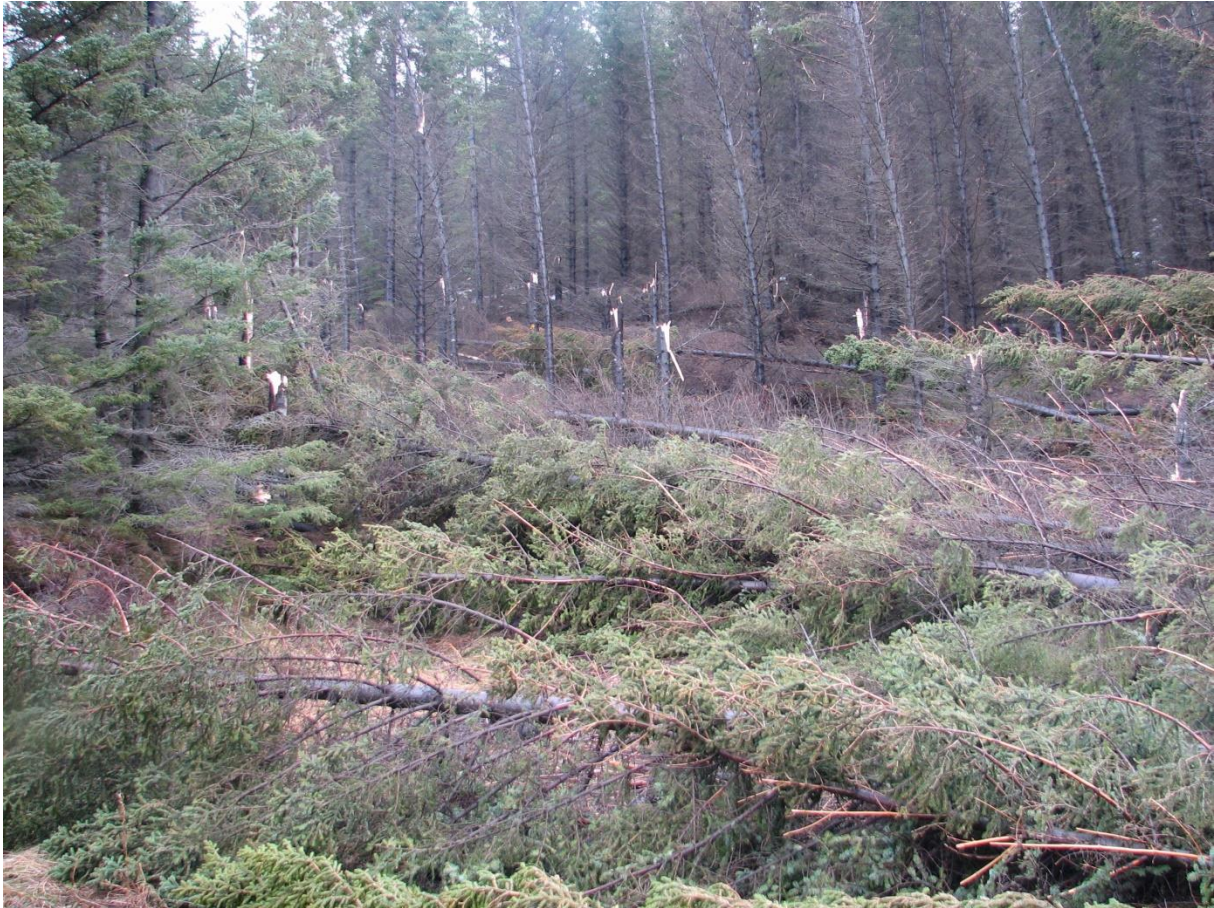
Mynd 2 hér er mynd sýnir sitkagreni sem lét undan í storminum 14.3.2015

Ekki bar mikið á öðrum sköðum í skóginum og engar sérstakar plágur sem herjuðu á trén. Þó varð eitthvað vart við birkikembu í Dölunum.