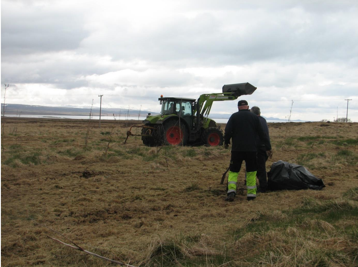
Mynd 3 Lionsmenn úr Búðardal gróðursetja í Laxaborg. Guðmundur í Geirshlíð í Hörðudal á traktornum að bora fyrir plöntunum.

Einnig var gróðursett á Stóru - Drageyri í Skorradal. 1200 plöntur af Selju fóru í eyður í eldri gróðursetningu í frekar rakt land. Þá voru 3000 plöntur af lerkiblendingnum Hrym gróðursettar í hlíð upp af gömlu túnunum í átt að hitaveitudæluskúrnum og að lokum voru gróðursettar 5025 stafafurur af kvæminu Watsonlake þær voru settar í framhaldi af Hrymnum í stefnu inn dalinn.