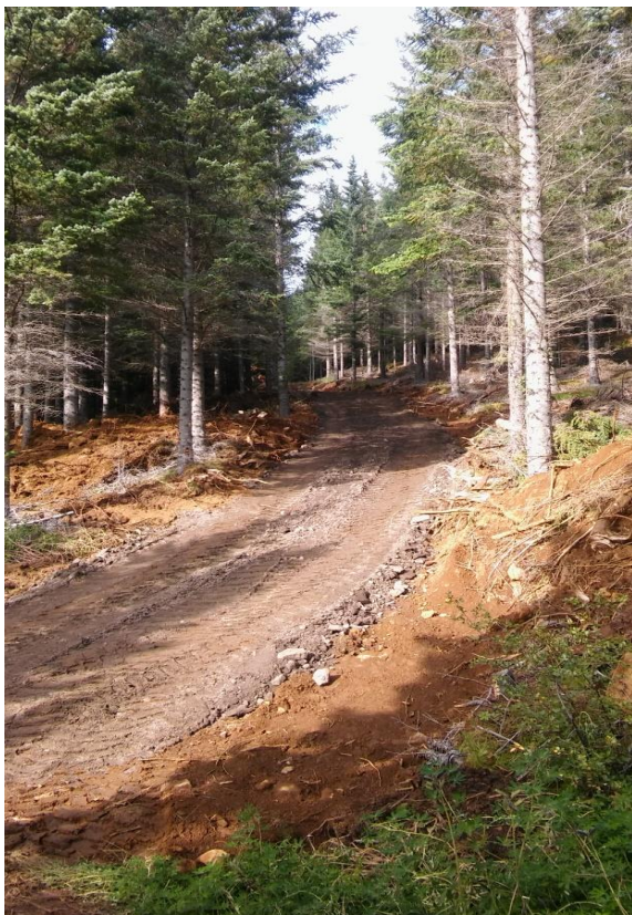
Mynd 7 hér er búið að leggja nýja braut í gegnum skógin.