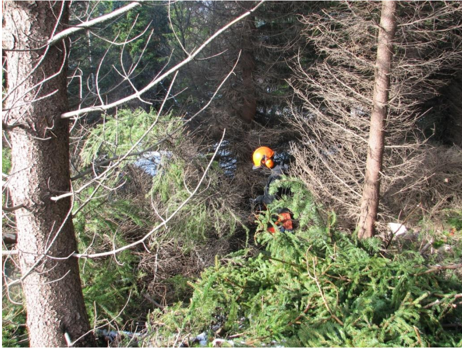
Mynd 4 Michelle frá Danmörku að grisja í Hvammi í apríl 2015.