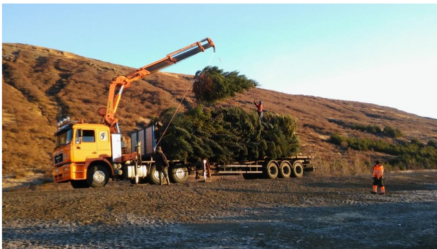
Mynd 5 hér er verið að flytja Torgtré til Reykjavíkur í nóvember 2015. Myndin er tekin á Fitjum þar sem við höfum fengið að leggja trén frá okkur þangað til þau eru flutt til Reykjavíkur.