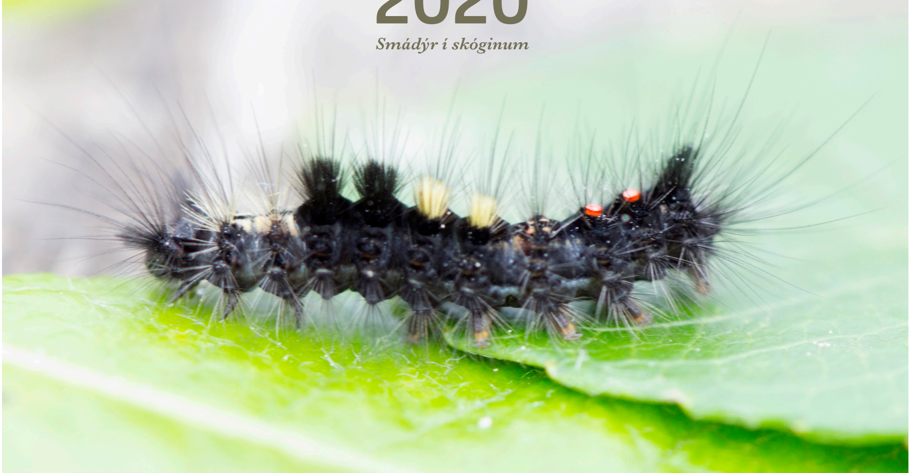
Skógbursta – Orgyia antiqua – Rusty tussock moth. Nýlegur skaðvaldur hérlandis á t.d. birki og víði.