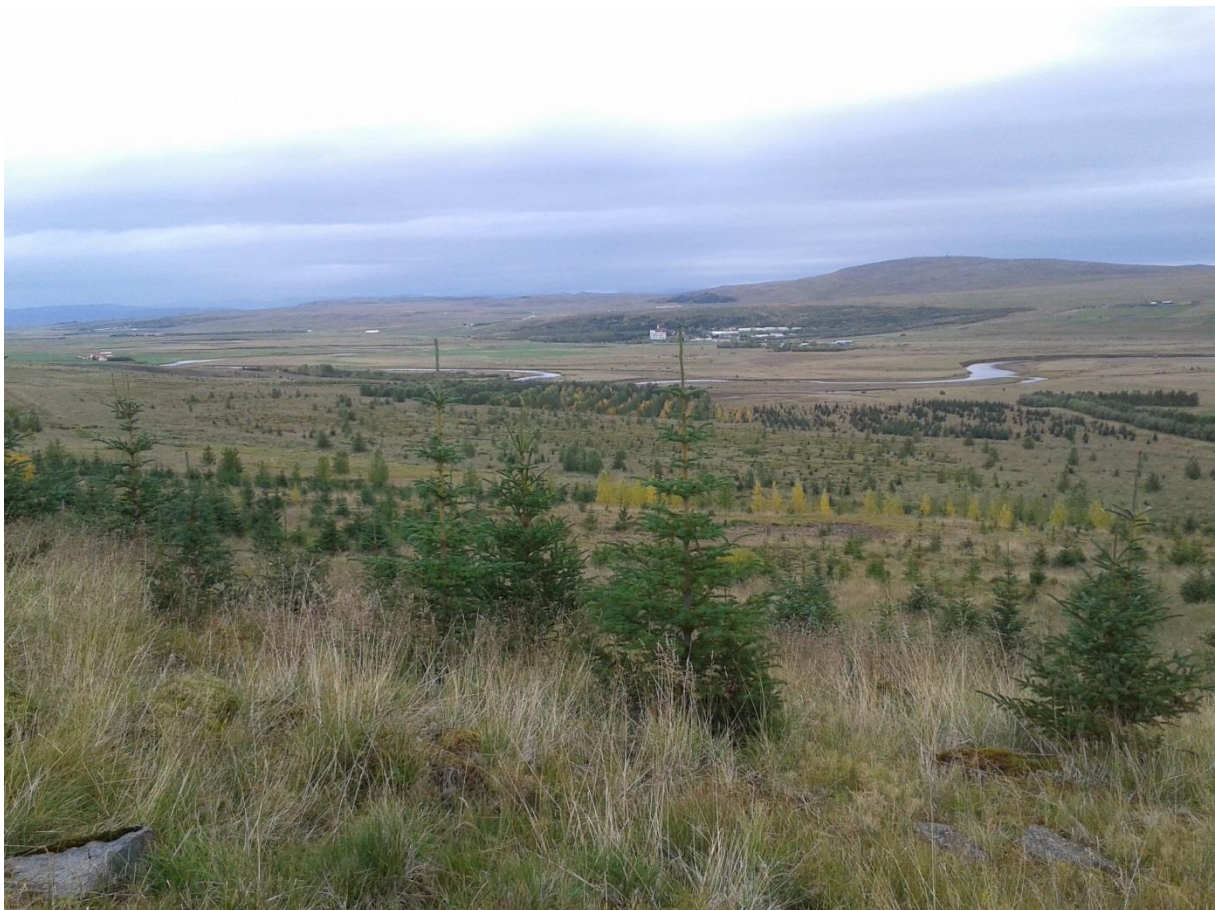
Þessi mynd er tekin í skógræktarsvæðinu á Vilmundarstöðum í Reykholtssdal, handan árinna er Reykholt.

Engin breyting var á umfangi dreifingarstöðva hjá Vesturlandsskógum þetta árið. Plöntum var dreift frá þremur stöðvum, Reit í Reykholtssdal, Erpsstöðum í Dalabyggð og Ræktunarstöðinni Lágafelli á Snæfellsnesi.