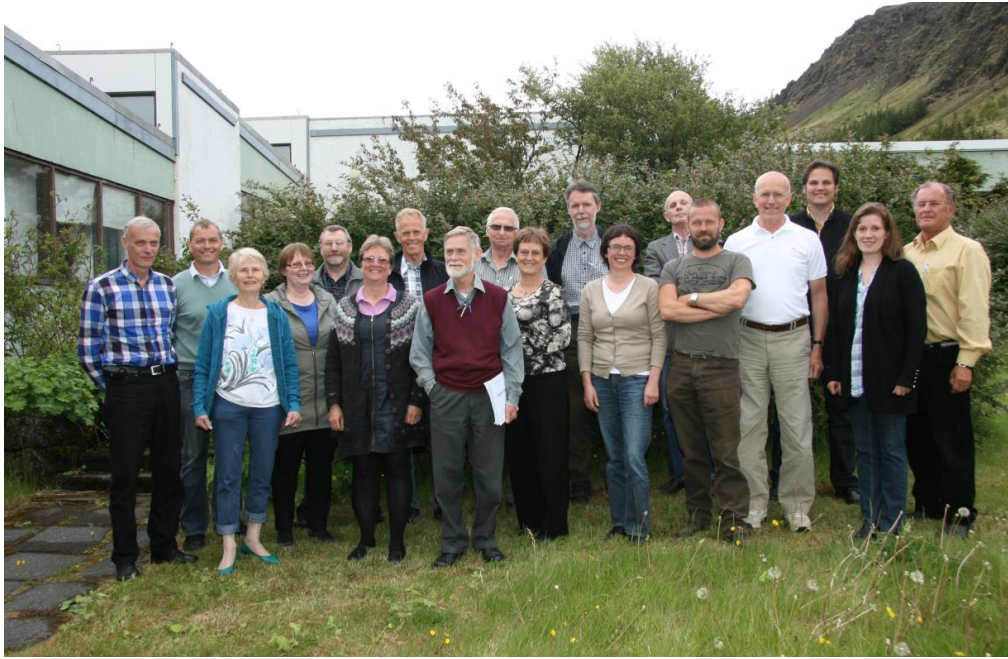
Útskriftarhópur Grænni skóga 2, 16. Júní 2012