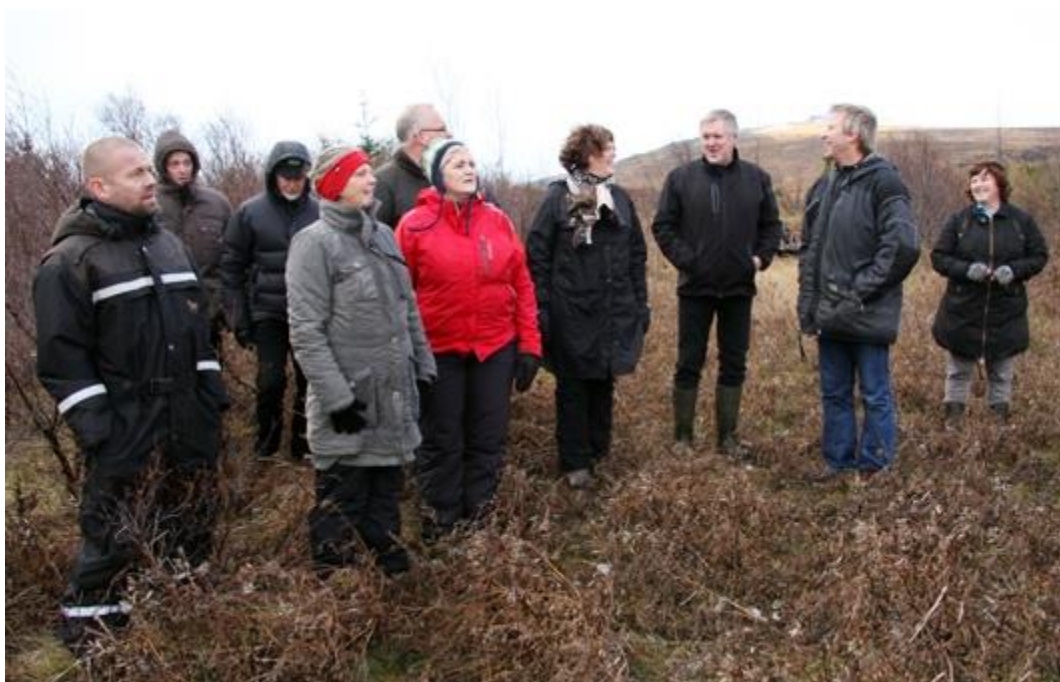
Svandís Svavarsdóttir í heimsókn að Steindórsstöðum.