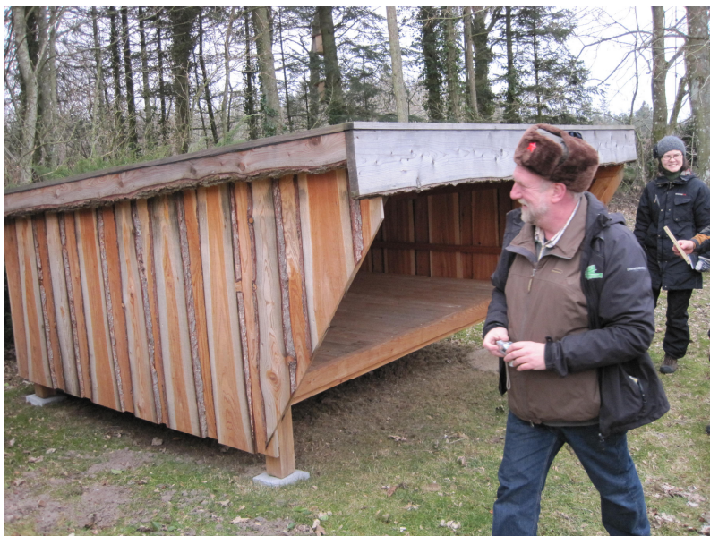
Vörubróun: Útileguskýli framleitt hjá tveggja manna sögunarmyllu á Jótlandi.