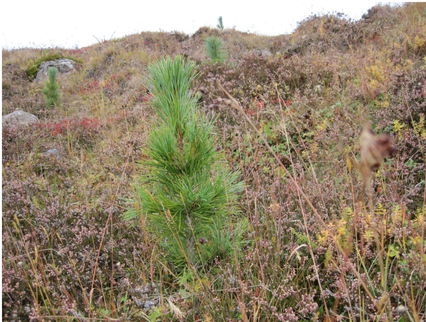
Lindifura vex á berangri án nokkurrar vaxtarstöðnunar á Oddsstöðum í Lundareykjadal.

Ein er sú trjátegund, sem lítið hefur verið notuð á Íslandi til þessa, en er heldur betur að sanna sig. Þetta er lindifuran, sem gróðursett var síðsumrs 2007 hjá nokkrum skógarbændum og hefur farið fyrnavel af stað. Nær ekkert er af eldri lindifuru á Suður- og Vesturlandi, ef undan eru skildir nokkrir einstaklingar í gamla furureitnum við Almannagjá. Hins vegar hefur tegundin sannað gildi sitt á Hallormsstað. Of snemmt er að fullyrða um framvindu hjá þessari tegund á Vesturlandi, þegar hún vex vel uppúr skjóli. En óneitanlega vekur það athygli, að hún skuli vaxa án nokkurrar vaxtarstöðnunar frá fyrsta ári!