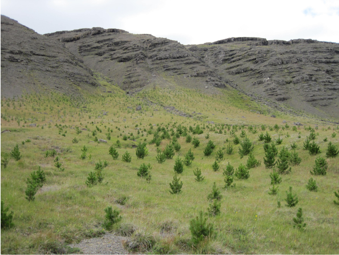
Ung stafafura á Möðruvöllum í Kjós.