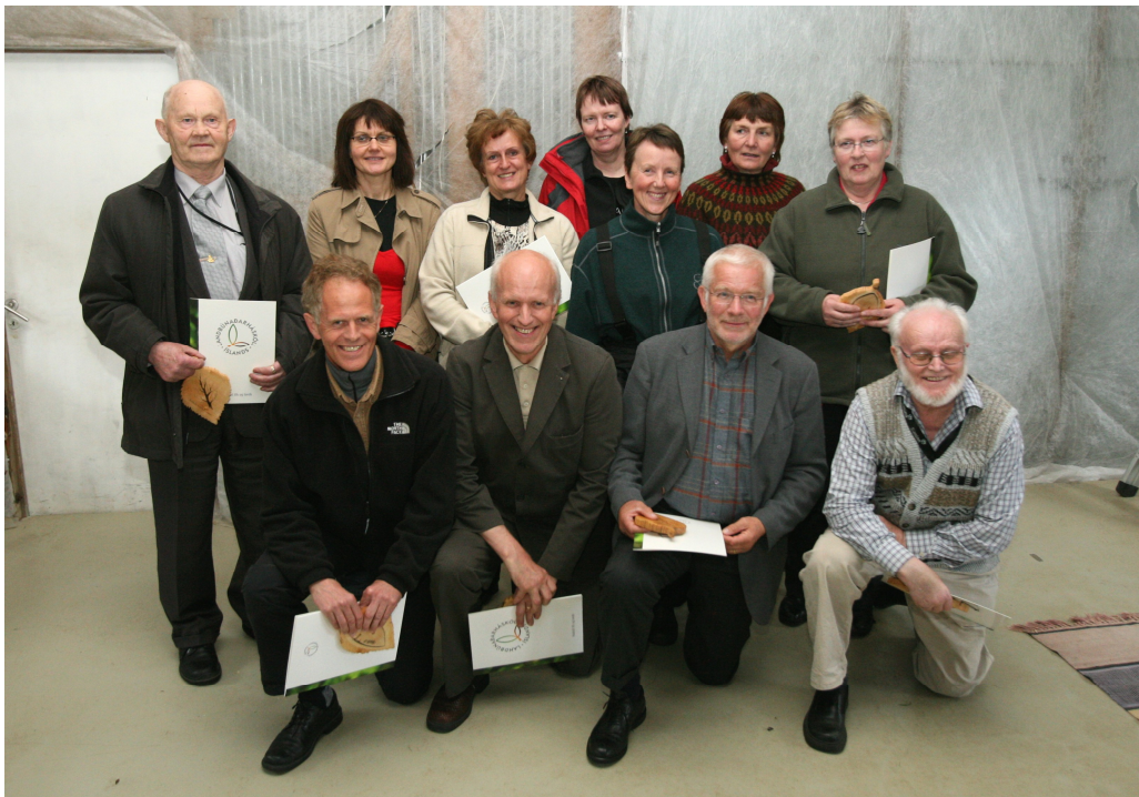
Útskrift nema úr Grænni skógum 1 fór fram að Fitjum í Skorradal 7. Júní 2008.

Fyrstu Grænni skóga I námskeiðaröðinni í samstarfi Vesturlandsskóga og LBHÍ lauk vorið 2008.