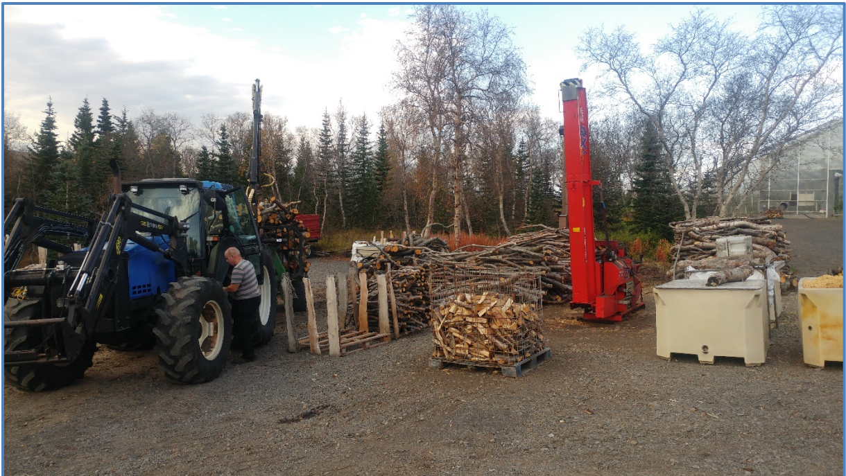
Vinnsluvæðið fyrir arinviðarframleiðsluna á Vöglum