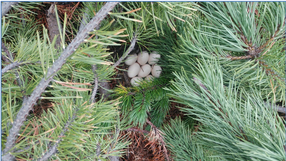
Mynd: Andarhreiddur innan um stafafurugreinar á Vöglum á Belamörk.