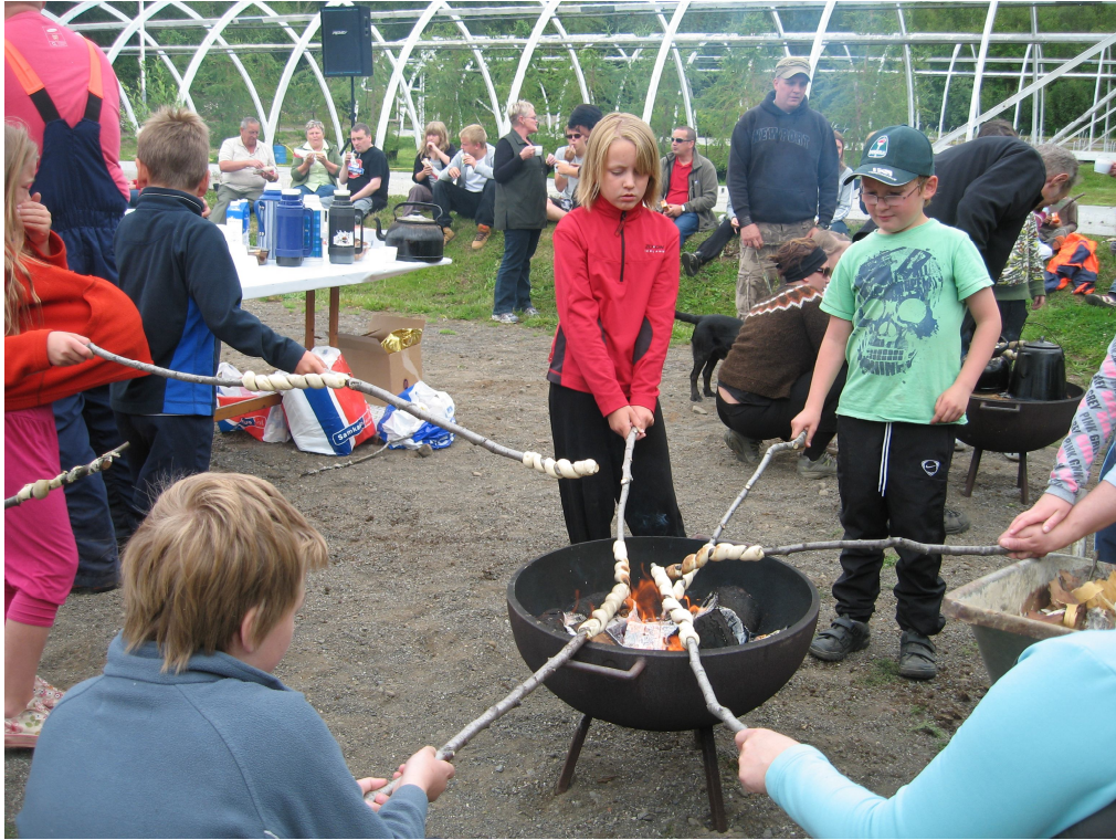
Opinn dagur í Vaglaskógi