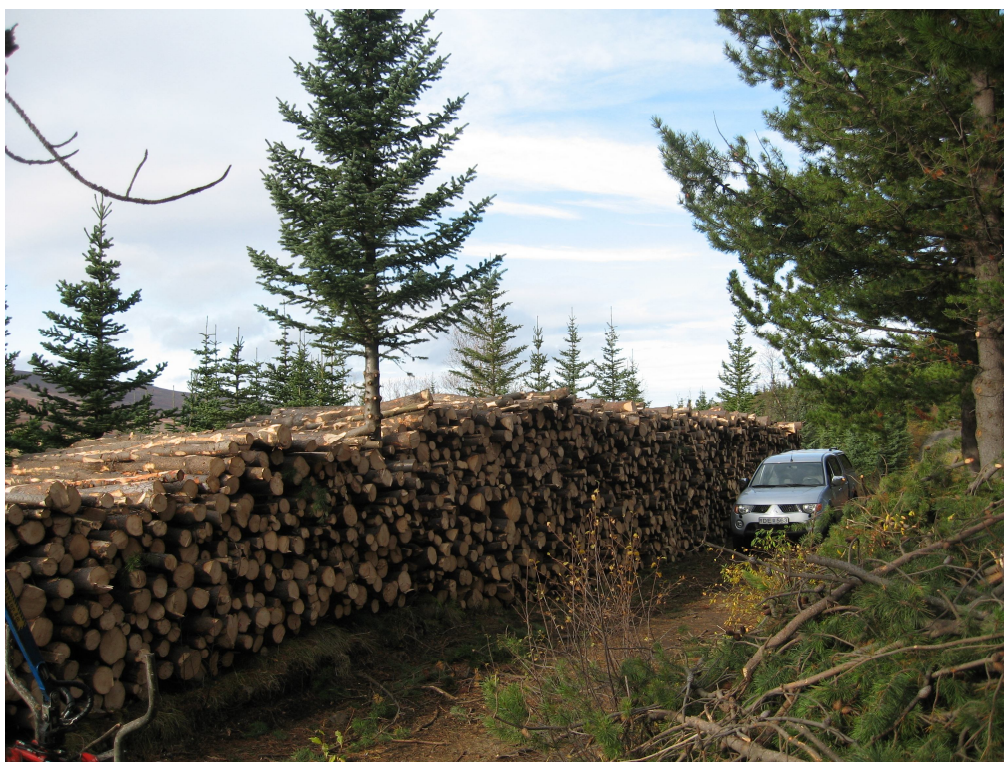
Viðarstaflí í Þórðarstaðaskógi