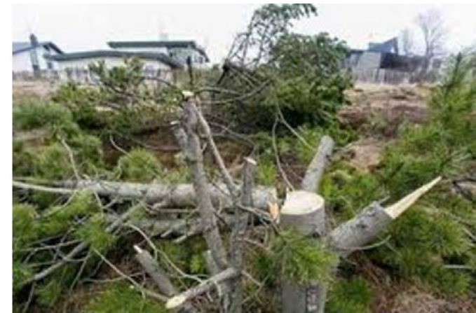
Útsýni - Breiðholt Rvk.