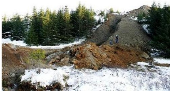
Vatnslagnir Heiðmörk. www.visir.is