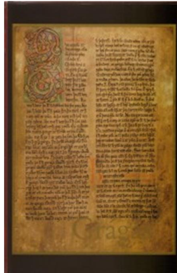
Grágás – forlagid.is