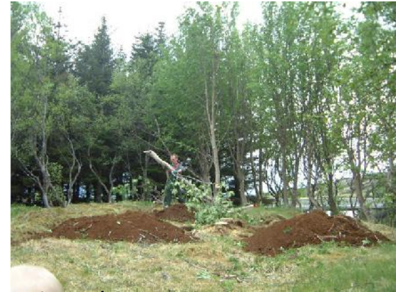
Rústir / fornleifar Þingvöllum