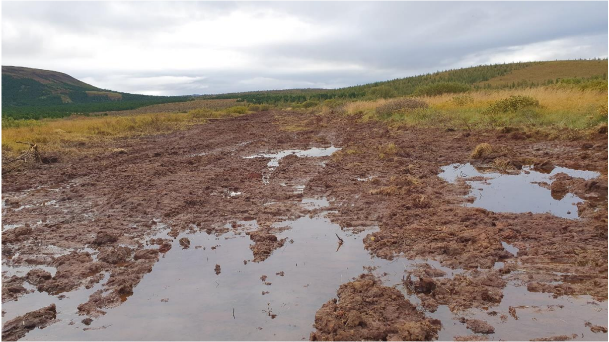
Mynd 6. Nú þegar er áhrifa endurheimtar farið að gæta í gamla skurðinum, vatn safnast fyrir og innan fárra ára verður rask vegna framkvæmdanna lítt sýnilegar.