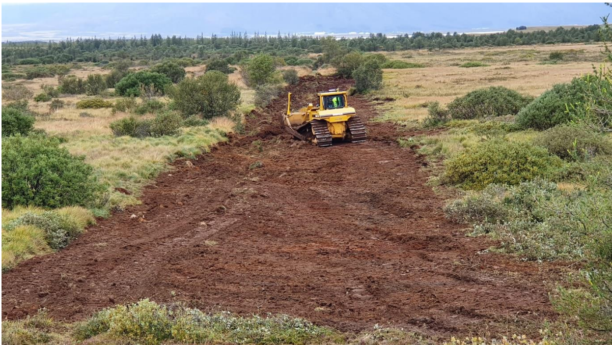
Mynd 1. Jarðýta Suðurtaks vinnur við að loka skurði í Mosfelli.

Skógræktin hefur umsjón með landi Haukadals sem er vestanmegin Tungufljóts. Það skóg- og kjarrlendi sem fer undir framkvæmdina er því að mestum hluta í landi Skógræktarinnar. Gerður var samningur milli HS Orku og Skógræktarinnar um endurheimt á skóglendi sem færi undir framkvæmdina. Sú endurheimt fór fram árið 2018 og var fjallað um í skýrslu á síðasta ári. Einnig var gerður samningur um endurheimt votlendis vegna framkvæmdanna og sú endurheimt að fara fram árið 2019 og fjallar þessi skýrsla um þær framkvæmdir.