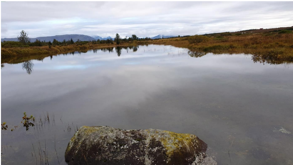
Mynd 3. Líkatjörn eftir að lokað var fyrir affall. Vatnsyfirborðið hækkar mikið og tjörnin komin aftur í eðlilega stærð.