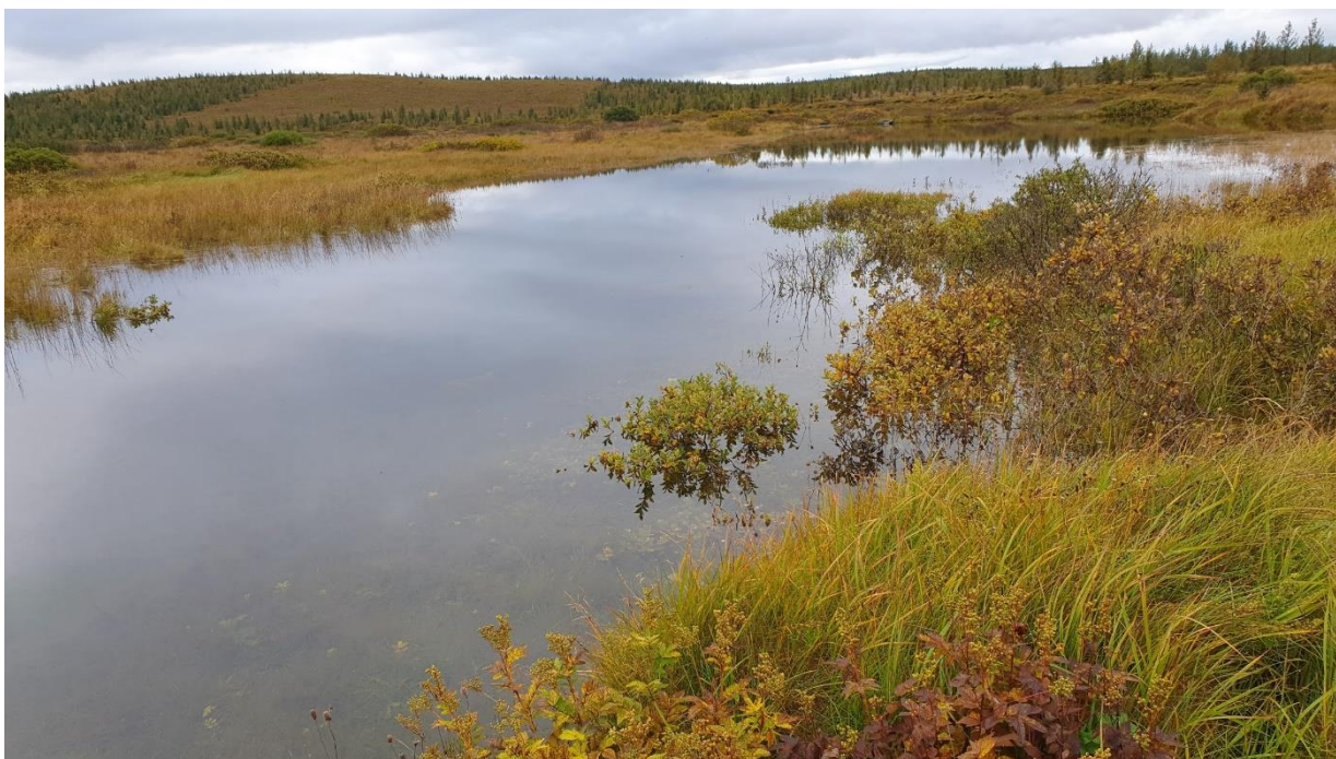
Mynd 4. Svæðið er vel gróið og fallegt er um að lítast í Mosfelli.

Áhrifasvæði endurheimtarinnar eru um 10 hektarar lands (mynd 5) og mun vatnsyfirborðið hækka á komandi árum en áhrifa þess er nú þegar farið að gæta (mynd 6.) en heildarlengd skurða sem fyllt var í er um 450 metrar.